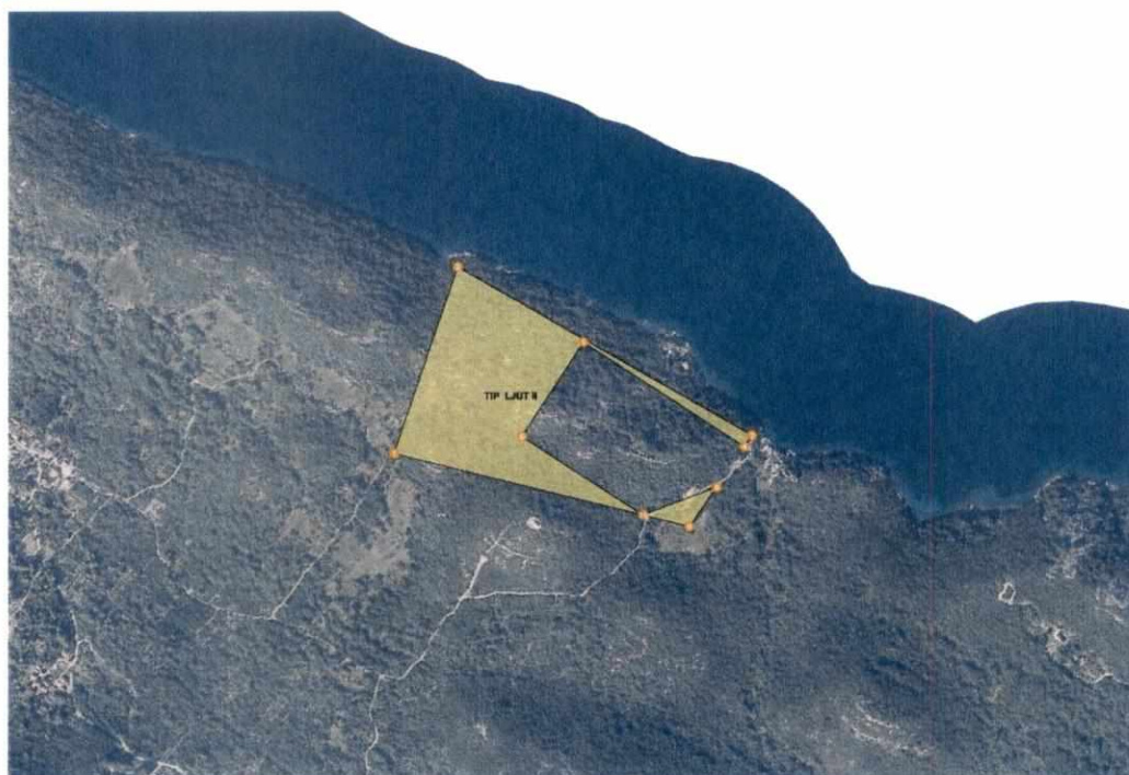
Grafički prikaz traženog istražnog prostora arhitektonsko-gradevnog kamena "Ljut II":